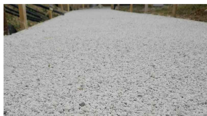
pavimentazione in calcestruzzo drenante DRAIN CALTIBER

Terrazzo lastre gres 80x80 - Marazzi My stone Ceppo di Gre' - colore Beige