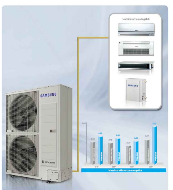
UNITA' ESTERNE SAMSUNG, SERIE DVM S MINI

LEGENDA Cantina di vinificazione Magazzino olio Cantina di conservazione locali tecnici/magazzini/servizi Nuova volumetria