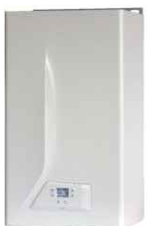
CALDAIA ITALTHERM, MODELLO CITY CLASS KW