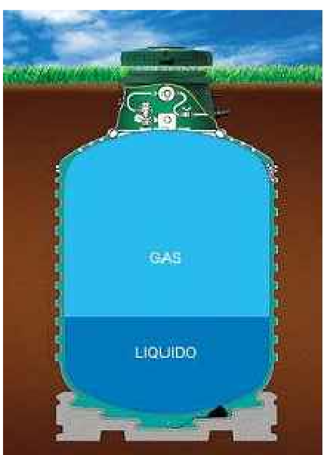
SERBATOIO GPL INTERRATO