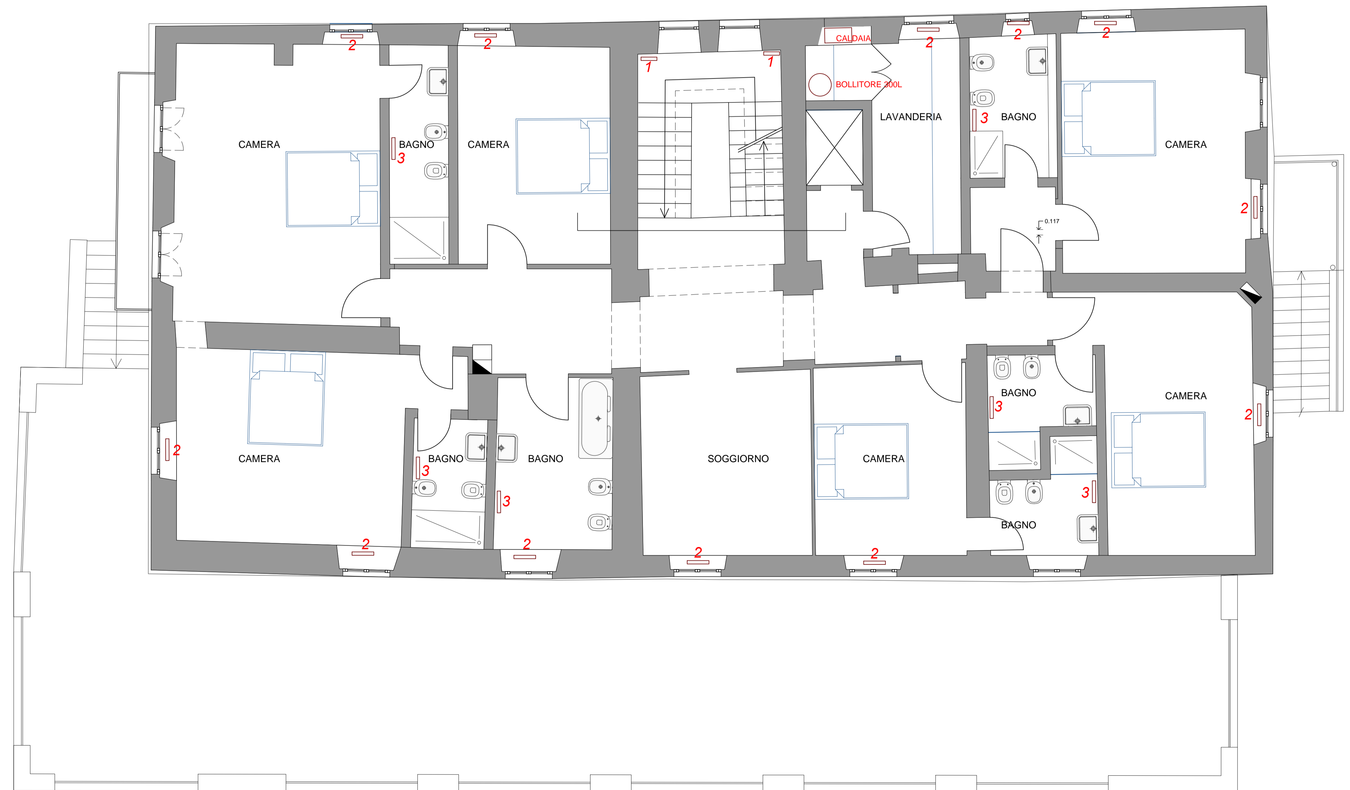
PIANTA PIANO PRIMO - IMPIANTO TERMOIDRAULICO SCALA 1:50