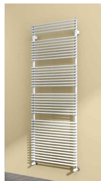
3 SCALDASALVIETTE IRSAP, serie FLAUTO