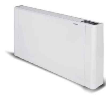
2 VENTILCOVETTORE SABIANA, serie Carisma CFR