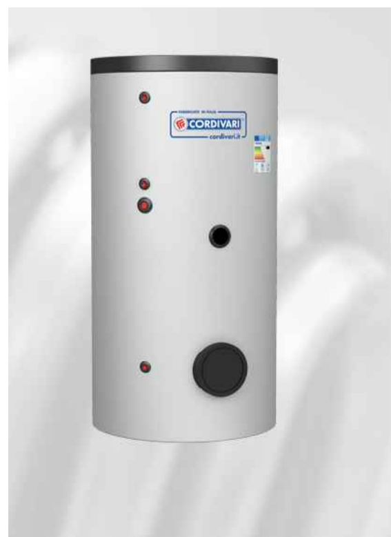
BOLLITORE 300L o 500L CORDIVARI, BOLLY 2 ST