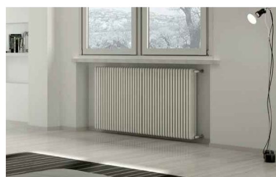
1 RADIATORE IRSAP, serie TESI