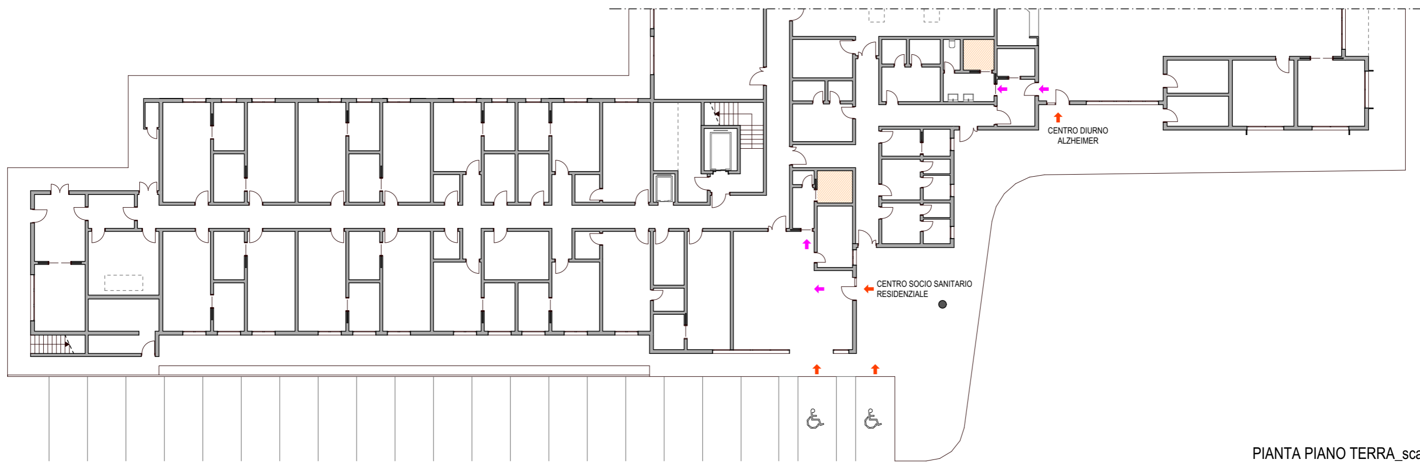
PIANTA PIANO TERRA_scala 1:250